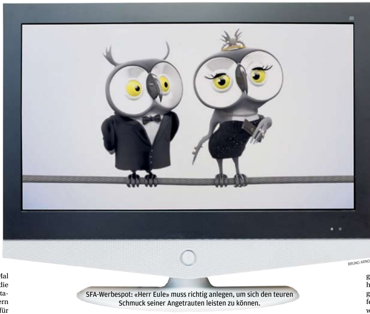
SFA-Werbespot: «Herr Eule» muss richtig anlegen, um sich den teuren Schmuck seiner Angetrauten leisten zu können.

Anlegerinnen könne die Unsicherheit mit einer umfassenden Beratung genommen werden. Doch diese ist teuer, entsprechend muss von Anlegerseite mehr investiert werden, bevor Finanzinstitute überhaupt dazu bereit sind. Zudem sei die Beratung häufig nicht auf Frauen zugeschnitten. «Werden in einem Beratungsgespräch zu viele Fachwörter verwendet, sind Frauen noch stärker eingeschüchtert», sagt Schubert. Deshalb sind Seminare für Frauen ein guter Weg, um ihre Anlagestrategie festzulegen. Es braucht also ein wenig mehr als TV-Spots.